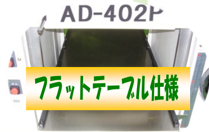
フラットテーブル仕様