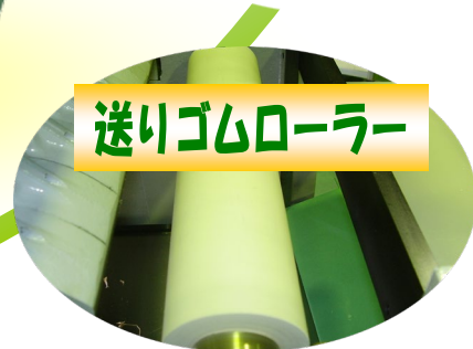
送りゴムローラー