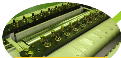
チップブレーカー前後