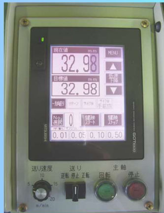
操作パネルデジタル表示1/100