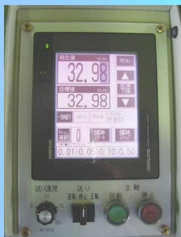
操作パネルデジタル表示1/100